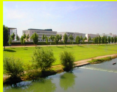
Vista des de el marge dret del riu Segre