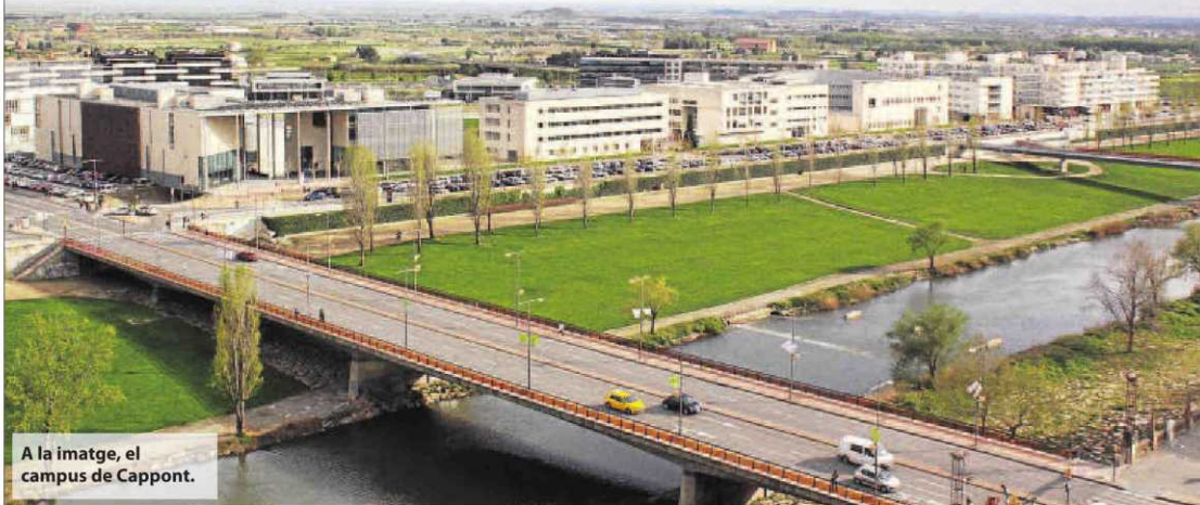
A la imatge, el campus de Cappont.

da per sempre" que els títols universitaris tinguin competències garantides en una tercera llengua. En aquest sentit, la Universitat de Lleida també aplicarà mesures per millorar el nivell d'anglès d'alumnes i docents.