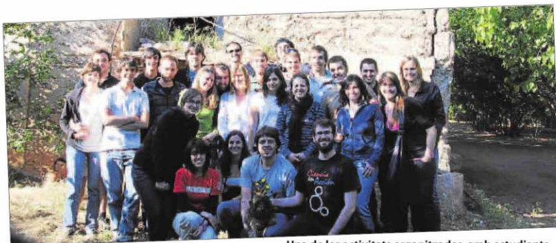
Una de les activitats organitzades, amb estudiants catalans i visitants, va ser una calçotada a Vallès.

Alumnes d'enginyeria de la UdL participen en intercanvis internacionals d'estiu que inclouen pràctiques en empreses de més de vuitanta països || A canvi, han d'organitzar l'estada i l'acollida d'alumnes d'altres nacionalitats que cursen la seua beca en empreses de Lleida