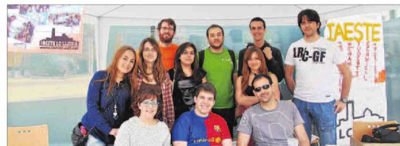
Els membres d'laeste Lleida van informar sobre el projecte en aquest estand a la festa major de la UdL.