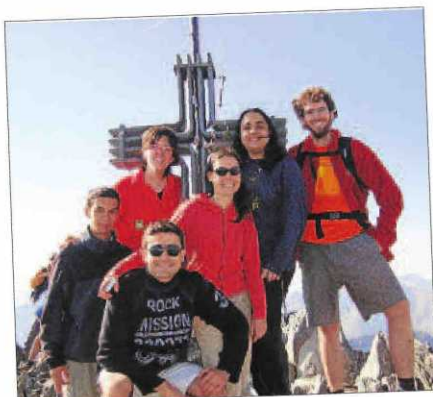
Visitants a Lleida, d'excursió a la pica d'Estats.