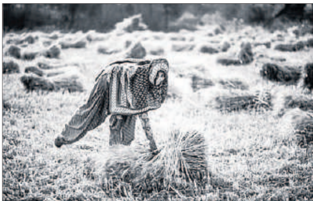
'Collita', de Pedro José Segura, a 'Dones rurals' de la UdL.

CENTRE D'INTERPRETACIÓ DE L'ANTIC COMERÇ (CIAC). SALAS DE PALLARS. Tot a mitges. Evolució de les mitges femenines 1909-1969. Fins al març.