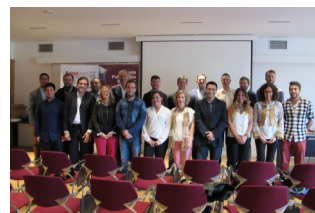
Alumnes de la 1a edició del Curs