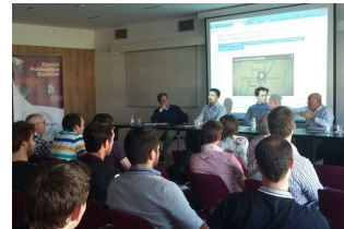
Un moment de la Taula rodona celebrada el passat 19 de maig a la Sala de Graus de l'EPS

Saps que ja pots matricularte a la 3a edició del Curs de Postgrau en disseny i gestió d'entorns BIM-REVIT ? [+INFO]