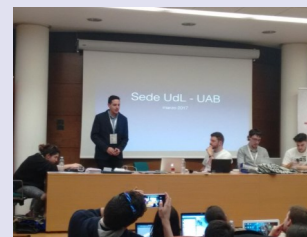
L'Escola Politècnica Superior de la Universitat de Lleida acollirà la celebració de l'assemblea XLVI i el 8è Congrés RITSI se celebraria a Barcelona, al tractar-se d'una candidatura conjunta amb la Universitat Autònoma de Barcelona.

nares i, posteriorment es realitzà el congrés RITSI a la Universidad Autónoma de Madrid on es van superar els mil participants inscrits. [+ INFO]