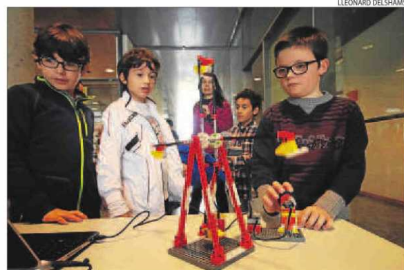
Les activitats complementàries van ser també protagonistes.