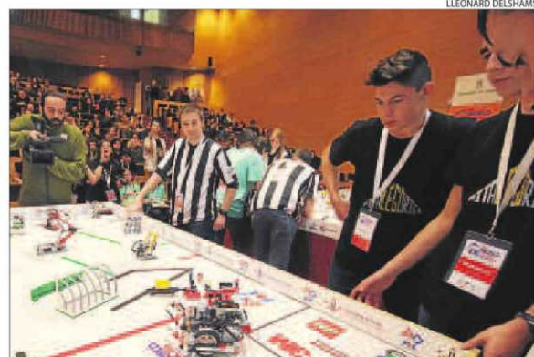
Dos integrants de l'equip Pitalegorics, que van quedar segons.