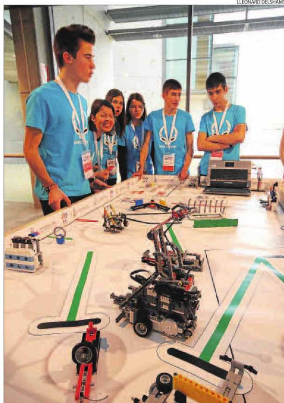
Membres de l'equip guanyador, l'Almetronix d'Almenar.