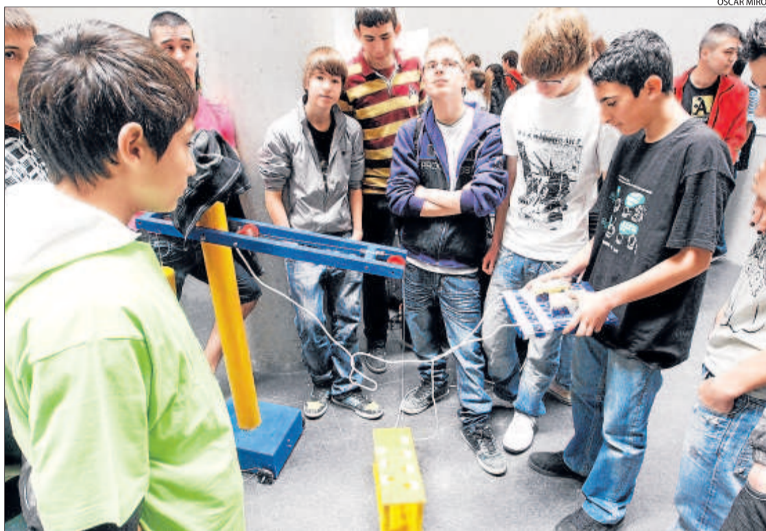
Un grup d'alumnes prova com funciona un dels invents.