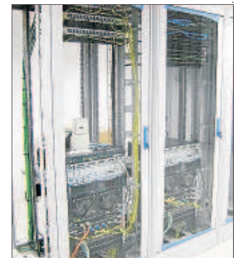
Comunicacions de fibra òptica.

■ El Centre de Processament de Dades és el punt en què connecten totes les línies de comunicacions del parc de Gardeny, permet gestionar-ne tots els sistemes informàtics i ofereix aquests serveis als grups d'investigació i empreses tecnològiques i d'enginyeria, que els poden usar per a les seues pròpies línies de negoci. Aquesta plataforma tecnològica ofereix a les firmes del parc prestacions difícilment abordables de manera individualitzada.