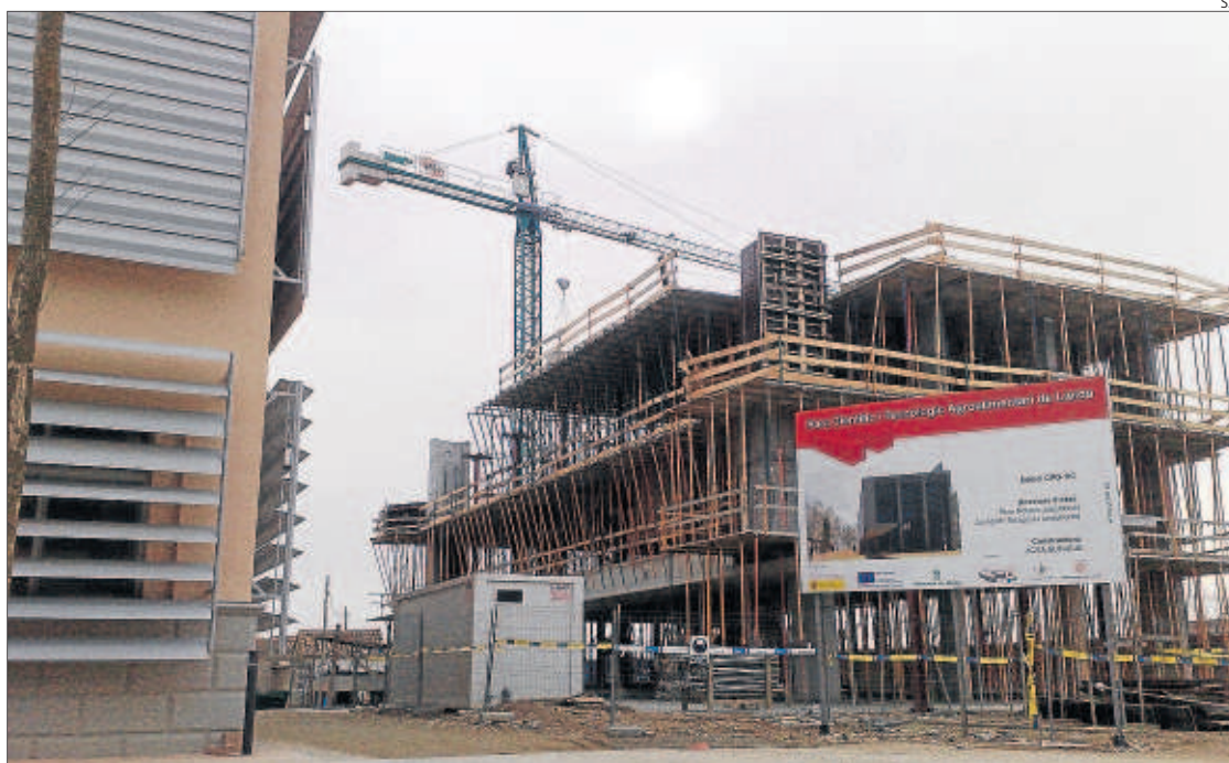
L'estat actual de la construcció de l'edifici destinat a viver d'empreses TIC, situat sobre el CPD.

Així mateix, permet gestionar tots els sistemes informàtics del parc i oferir aquests serveis als grups d'investigació i empreses tecnològiques i d'enginyeria per a les seues pròpies línies de negoci i clients. Disposa de sala d'ordinadors, telecomunicacions, energia i climatització, control i magatzem. En conjunt, 635 metres quadrats construïts, tots sota terra, que ofereixen a les