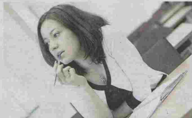
Idiomas e informática son complementos imprescindibles en la formación