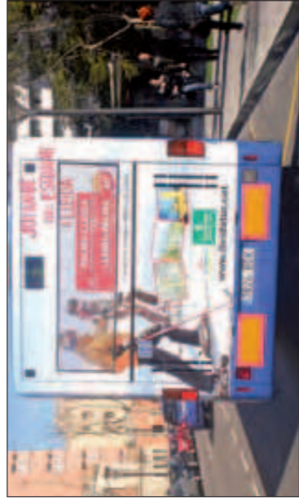
La imatge del Pirineu de Lleida ja és visible en tres autobusos

Aquesta acció promocional està centrada en l'oferta d'esqui als 11 centres d'hivern del Pirineu de Lleida, així com també a remarcar els horaris dels vols d'anada i tornada de Lleida a Palma de Mallorca, la durada del vol i a promoció- nar la pàgina web del Patronat de Turisme ( lleidatur.com ), on el visitant pot trobar tota l'oferta turística de Lleida durant tot l'any. ■