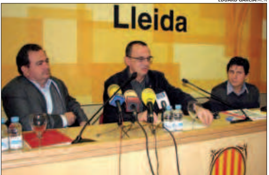
Un moment de la presentació dels resultats