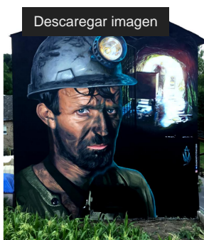
El Camino Obsoleto y la minería (Agosto 2018) Iglesia, León, España.