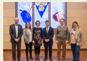
Nou equip de direcció de l'EPS