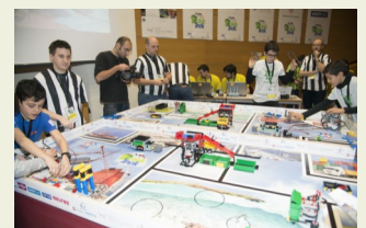
FLL a Lleida