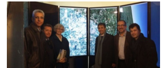
Delegació de la Universitat Federal de Lavras (Brasil)

i matemàtic, però també en els camps de l'enginyeria mecànica, l'energia i la construcció.