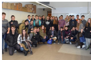
Grup d'estudiants a la JCO de l'EPS