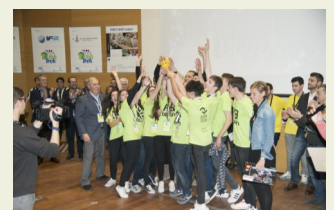
The Re-bbish, guanyadors de la FLL Lleida