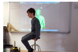
Taller de Disseny Gràfic de l'EPS a l'Institut La Mitjana de Lleida