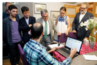
Visita una de les famílies

blert un marc de col·laboració institucional amb l'Escola Politècnica Superior de la Universitat de Lleida per a la realització de les auditories energètiques als habitatges [+ INFO]