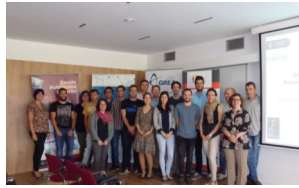
Els investigadors de SOPPORTES a l'EPS

nat SOPPORTES, dedicat a la identificació de barreres i oportunitats sostenibles en els materials i aplicacions de l'emmagatzematge d'energia tèrmica [+ INFO]