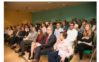
Resolució convocatòria Programa UdL- Impuls a l'ETSEA