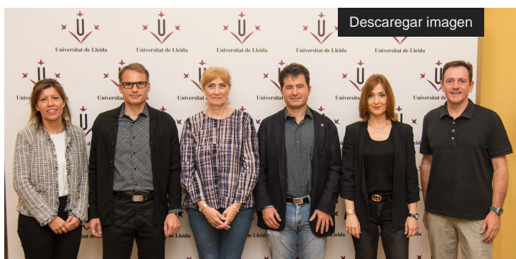
Acte de renovació del projecte Sinergia, abril 2018

Projecte Sinergia per a l'impuls de les vocacions STEM