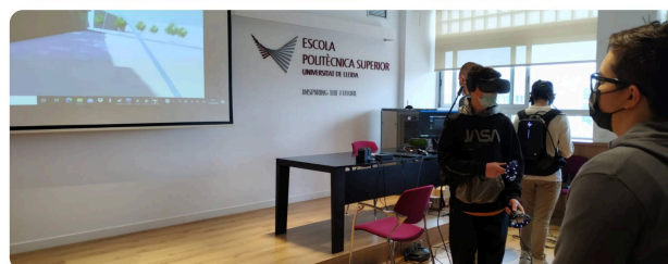
Jornada d'Orientació Universitària amb l'alumnat de 4t d'ESO de l'Institut Ronda. Taller de Realitat Virtual

/export/sites/Eps/ca/info_per/futurs-alumnes/espai-secundaria/Cataleg-Tallers-Secundaria-vdef.pdf ] amb 26 opcions a la seva disposició.