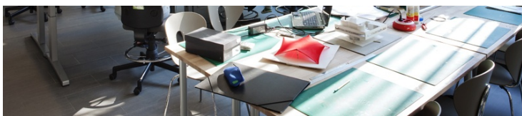
Sala d'arquitectura, disseny i arts plàstiques ETSA

A partir del curs 2017-2018, els horaris de les dues formacions es generen de forma que els alumnes de segon curs del GATE puguin cursar simultàniament assignatures de la formació d'Arquitectura a Reus. Això permetrà que els